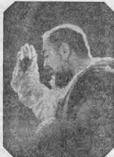
EL PADRE PIO

Desde Roma se hará una visita al Santuario de "La Madonna delle Grazie" don. de efectúa su benéfica y salvadora labor en favor de las almas el estigmatizado Padre Pio. Centenares de visitantes buscan consuelo y alegría en su confesionario e imploran su sacerdotil bendición.