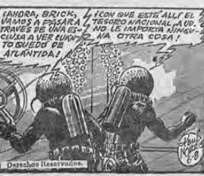
Derechos Reservados. (MAY 1962)