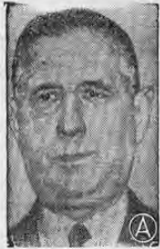
PRESIDENTE DE GAULLE ...tres atentados en un año...

PARIS, 22. AP—Unas fuentes informadas de la prefectura de policía de París dijeron hoy que alguien hizo varios disparos contra el Presidente Charles de Gaulle.