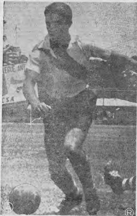
Anoche se despidió el gran interior florense con un partidazo que no lo veíamos desde mucho tiempo. Fue el factor principal del triunfo heradiano anoche ante los isidreños.