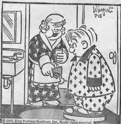
© 1960, King Features Syndicate, Inc., World rights reserved.